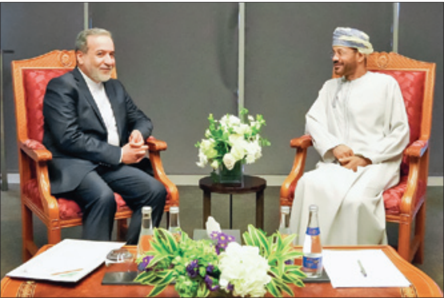
عباس عراقچی قبل از آغاز مذاکرات، وزیر خارجه در تهران دیدار کرد

اولین دور مذاکرات تهران واشینگتن «سازنده»، «مبتنی بر احترام متقابل» و در «فضای آرام» برگزار شد