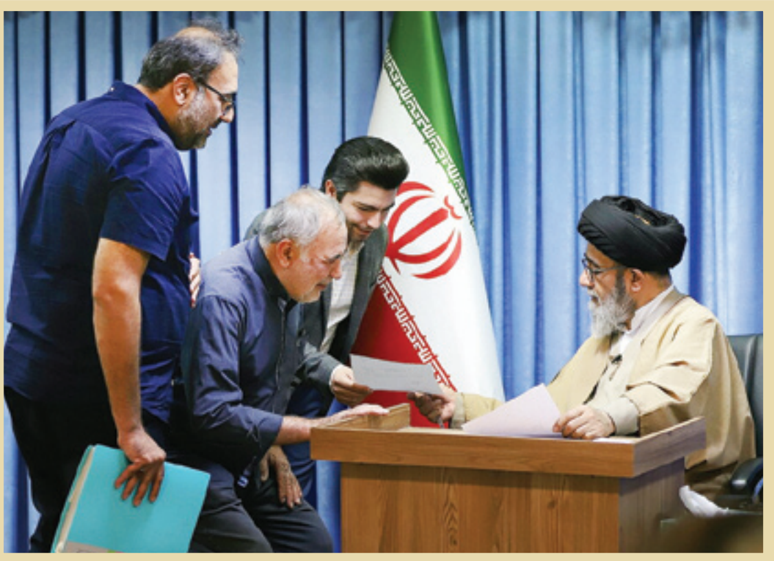
مسجده کریم خان تبریز. شهید آیت‌الله سیدمحمدعلی آل‌هاشم در حال رسیدگی به مشکلات مردم

بنده هر روز که خاطرات این هفت سال را مرور می‌کنم، صحنه‌هایی به یادماندنی در ذهنم تداعی می‌شود.