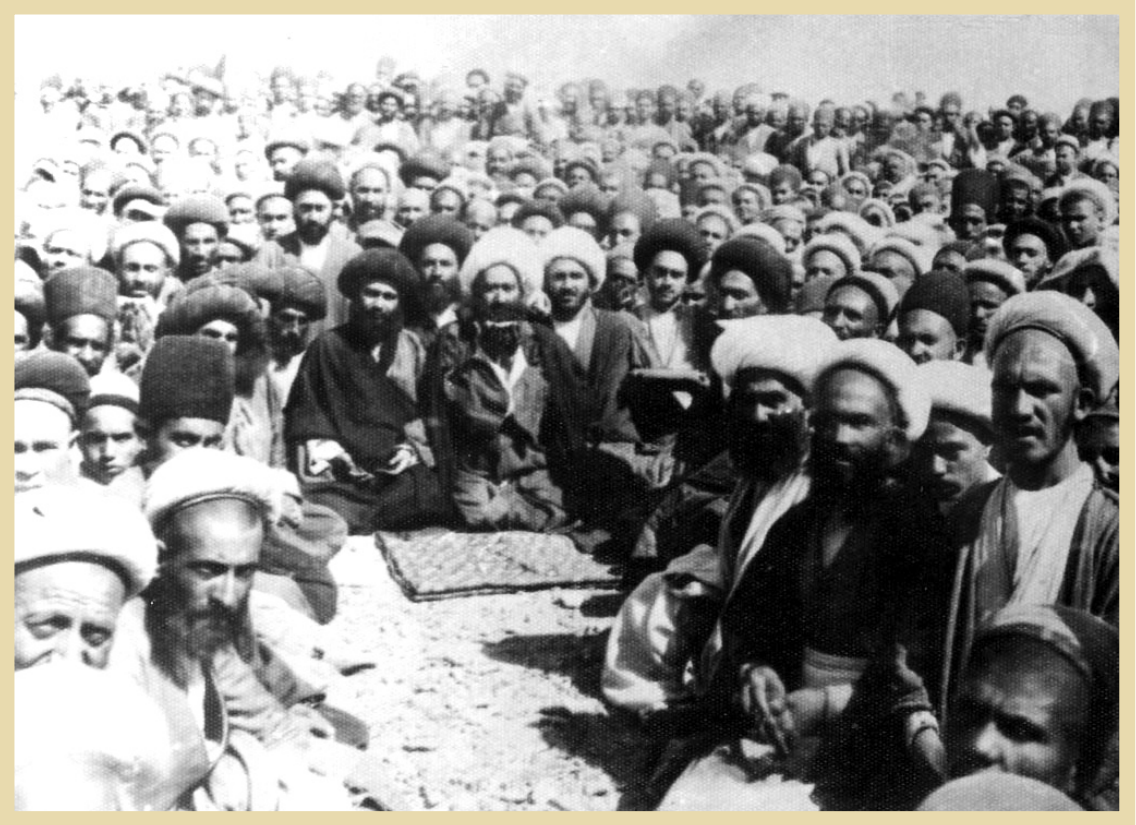
آیت‌الله آقا نجفی اصفهانی در حلقهٔ جمعی از روحانیون و مردم

آیت‌الله‌العظمی محمد تقی نجفی اصفهانی و عمری مبارزه با استعمار سیاسی و اقتصادی