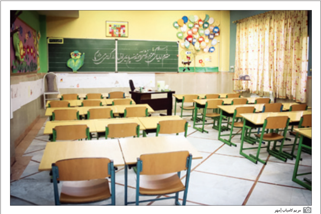
مریم کاماب امهر