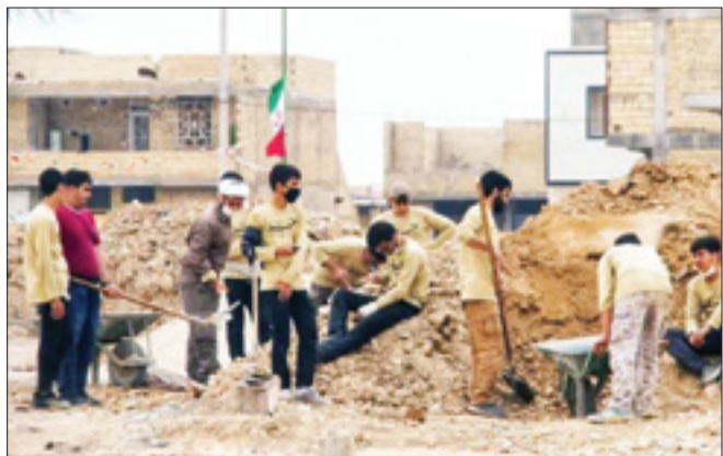
بسیج شجره طیبه‌ای است که همه از نعمت و جودش بهره‌مند هستند، اگر بپردازیم به چگونگی شکل‌گرفتن، هیچ کس نمی‌تواند بگوید که بسیج در پشت میز و اتاق‌های بسته شکل گرفت.

بسیج شجره طیبه‌ای است که همه از نعمت و جودش بهره‌مند هستند، اگر بپردازیم به چگونگی شکل‌گرفتن، هیچ کس نمی‌تواند بگوید که بسیج در پشت میز و اتاق‌های بسته شکل گرفت. امنیت، اقتدار، جهاد، خدمت بی‌منت، حل مشکلات معیشتی، آموزش علم و تربیت فرزندان ایران زمین تنها گوشه‌ای از برکات این درخت تناور است. بسیج در شرایط غیرمعمول با به میدان می‌گردد و با واکنش سریع اقدامات حیاتی و ضروری را برای تثبیت موقعیت انجام می‌دهد. بحران کرونا یکی از آزمایش‌های موفق بسیج بود که هزاران نفر از جامعه پزشکی، جهادی و خیر به‌دار قالب طرح‌های شهید سلیمانی و اردوهای جهادی و کمک‌های مؤمنانه به یاری جامعه شتافتند. بسیج هنگام مشکلات اقتصادی باری گرد دولت‌هاست و بسیجی بودن به این معناست که هر جا ولایت فقیه تشخیص داد در همان زمان و مکان به نقش آفرینی و خدمت می‌پردازد. بهره‌بردار از ظرفیت تنخبران بسیجی موجب رفع بسیاری از معضلات جامعه خواهد شد، تکیه‌گاه بسیج خداندان است و بسیجی نه به مادیات، وسایل، تجهیزات و داشته‌های خودش بلکه تنها به خدای خود می‌بالد.