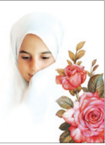
حجاب بوی خوش عفاف و پاکدامنی است