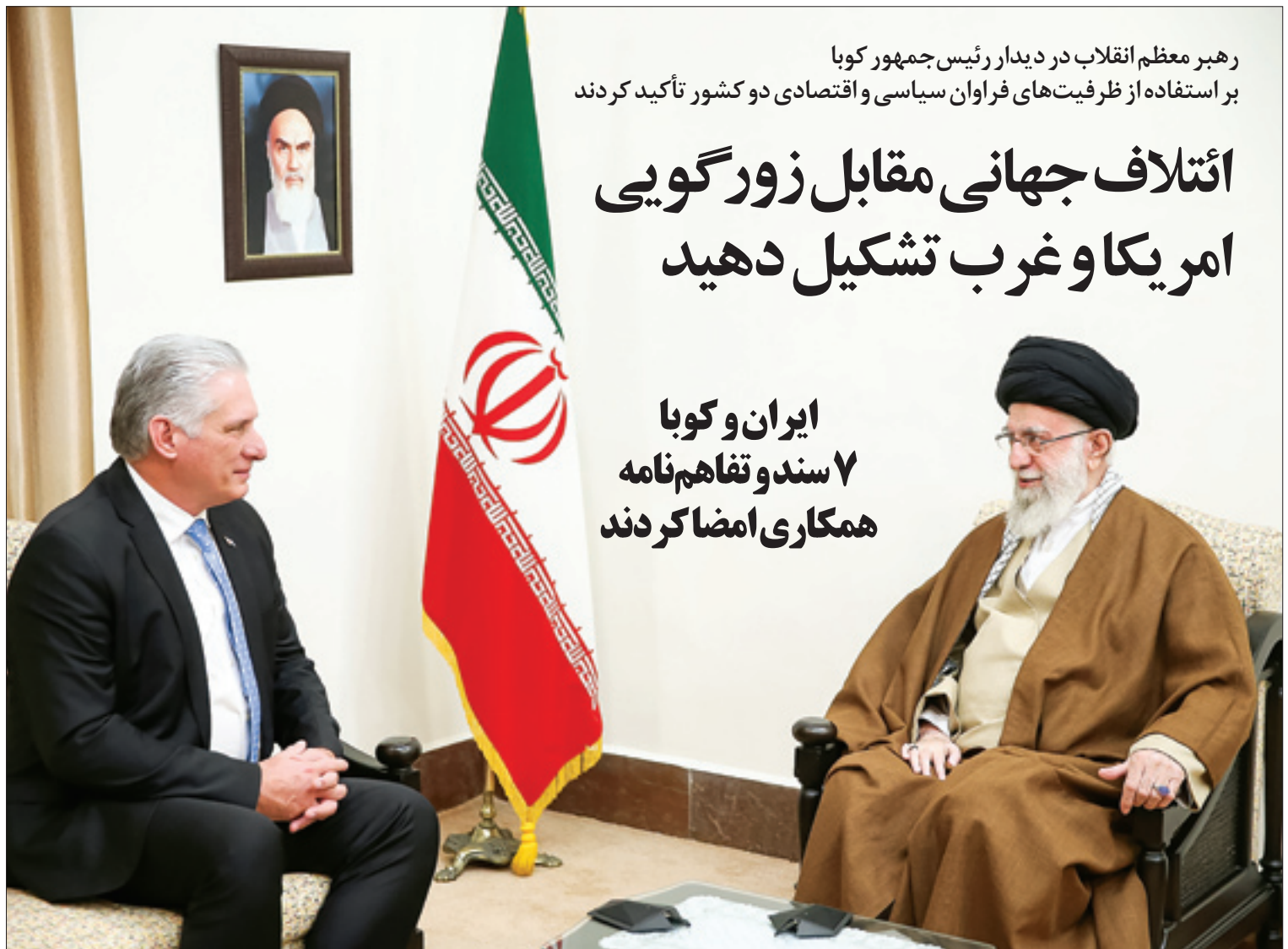
رهبر معظم انقلاب و ویژگی‌های مشترک انقلاب کوبا با انقلاب ایران را «صداقت، ایستادگی و جدیت انقلابی» معرفی کردند و پیشنهاد ائتلاف جهانی مقابل زورگویی امریکا را دادند | صفحه ۲

ایران و کوبا ۷ سند و تفاهم‌نامه همکاری امضا کردند