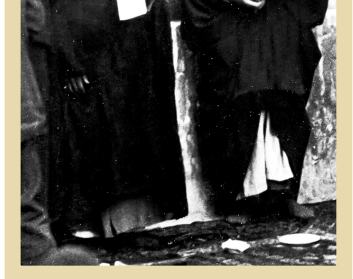
شهید سید مجتبی نواب صفوی در کنار آیت‌الله سیدابوالقاسم کاشانی

دومین تظاهراتی که به نفع مردم فلسطین انجام گرفت نیز، به دعوت آیت‌الله کاشانی بود. او در ۳۰ اردیبهشت ماه ۱۳۲۷، مجدداً مردم را علیه تشکیل دولت اسرائیل به تظاهرات دعوت کرد. بعداز ۳۱ اردیبهشت ماه و با دعوت ایشان، تظاهرات عظیمی علیه صهیونیست‌ها در تهران به راه افتاد. آیت‌الله کاشانی آن روز در میان جمعیت انبوهی که در مسجد سلطانی حضور یافته بودند، گفت: «این مصیبتی که اخیراً برای برادران مسلمان فلسطین پیش آمده و ایرانیان را برای همدردی و اظهار تأثر در این مکان گردهم آورده، منشأ آن حس برادری و عواطف دینی و اسلامی است که همه متحدان تأثر و تألم خود را باقلبی آز رده و خاطری پریشان، به سماع عموم مسلمین