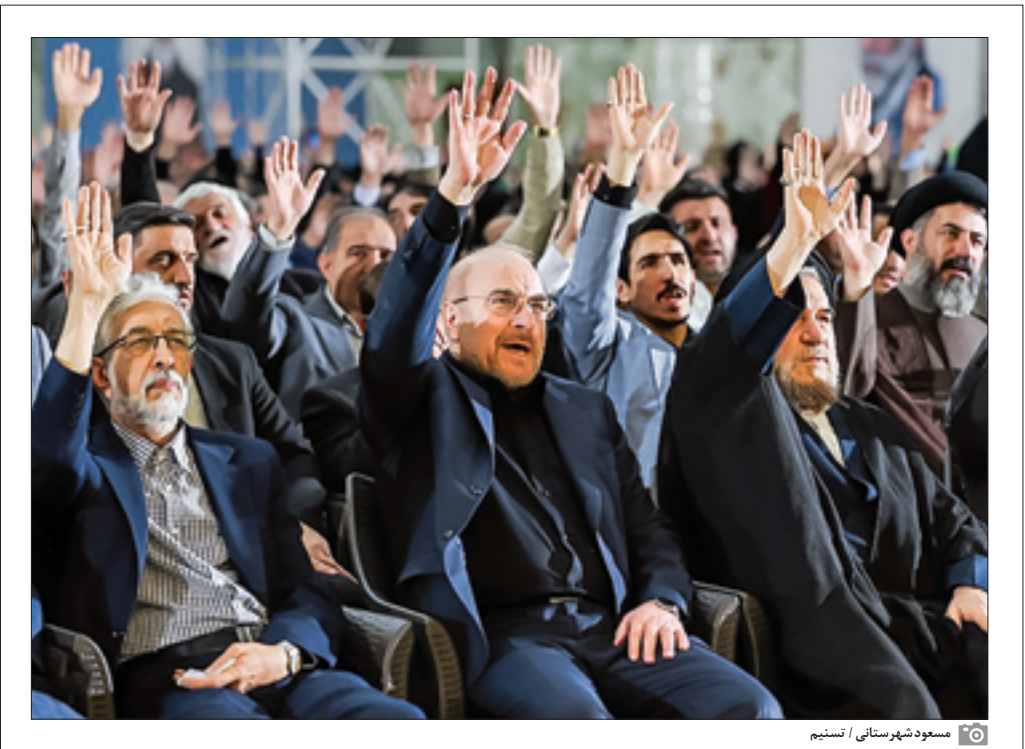
مسعود شهنرستی / تسنیم