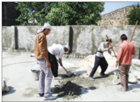
جهادگران قرارگاه‌ها (مراغه) ۱۶۵ خانه برای محرومان ساختند