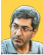
حبیب‌احمدزاده نوسنده وفیلمانه‌نویس