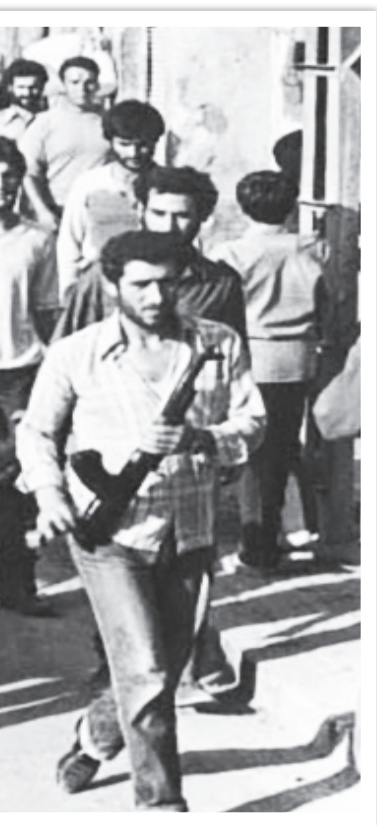
تصویری از رژه قوای محمد در خیابان‌های دمشق

من آن موقع سن کمی داشتم. بعضی از بچه‌های دیگر هم مانند من خبر نداشتند که مزار خانم زینب آنجا است. عرض کردم که وقتی گفتند اولین برنامه ما رفتن به حرم بی‌بی است، خیلی از بچه‌ها از شوق رفته کردند. اتوبوس‌های ما در میان جمعیت مردم که به استقبال مان آمده بودند در خیابان‌های