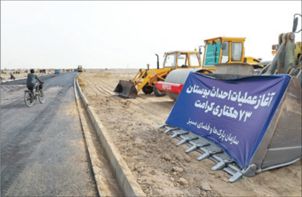
میدان شهدای شهریار

محمد رضا هادیلو عملیات اجرایی احداث بوستان ۷۳ هکتاری «کرامت» به عنوان یکی از مدرن ترین پارک‌های کشور که دارای هشت باغ و امکانات و تجهیزات کامل خواهد بود در مشهد مقدس شروع شد. فاز اول این پارک که محور توسعه و توازن شهر به شمار می آید تا اردیبهشت ماه سال آینده باید به بهره‌برداری برسد اما