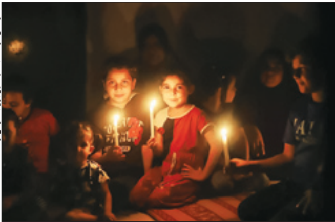
کودکان غزه، شبههارا بدون برق بهسفر می‌برند

سیدمسعود علوی تیار اینگونه شعرخوانی کرد: این لاته عنکبوت کز هم بگسست این گنبد آهنین که در هم بشکست پیغام حماس است که پایانی سخت هر لحظه در انتظار اسرائیل است