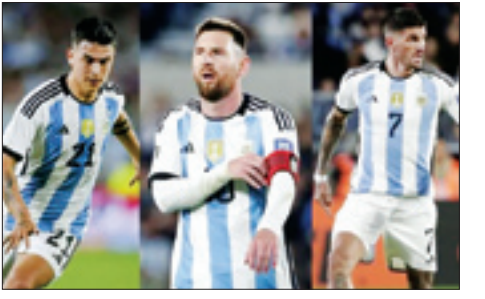
چالش جدی قهرمان جهان