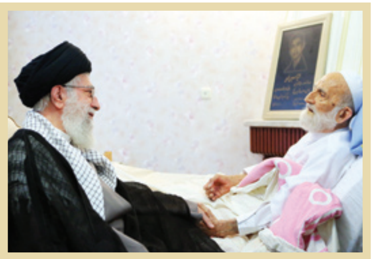
۱۳۹۳، رهبر معظم انقلاب اسلامی، در عیادت از آیت‌الله ابوالقاسم خزعلی

ایشان بسیار با قرآن و نهج‌البلاغه انس داشتند. خاطررم است که در دوره‌ای، امام جماعت مسجدالنبی(ص) حذیفی نامی بود که با شیعیان زاویه داشت. او در یکی از سفرهای مرحوم والد به حج، آیات مختلف را با شماره آن از ایشان سؤال کرد و پدرم بدون تأمل، ایین آیات را می‌خواندند. او حتی در برخی سؤالات گمراه‌کننده خود، دو آیه را تلقیح می‌کرد و در باره آن می‌پرسید! پدر به سرعت می‌گفتند بخش اول. مثلاً آیه ۱۸۲ سوره بقره و قسمت بعد، جزئی از آیه ۴۳ سوره مائده است! در آخر این جلسه، حذیفی گفته بود: «این فرد معجزه قرآن است!». یک بار هم سر کلاس نهج‌البلاغه در دانشگاه امام صادق(ع)، برای اینکه دانشجویان به این کتاب شریف علاقه پیدا کنند، فرموده بودند: «می‌دانید که حفظ کردن نهج‌البلاغه، سخت‌تر از حفظ کردن قرآن است. من از امروز شروع می‌کنم