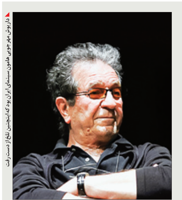
داریوش مهرجویی هامون سینمای ایران بود که اینچنین تلخ از دست رفت

● همسر شهید علیرضا نوری از شهدای شاخص دفاع مقدس در گفت‌وگو با «جوان»: یکی از هم‌زمانش در مورد شهید برای ما تعریف می‌کرد علیرضا آدم عجیبی بود. از آن دست رزمنده‌هایی که نماز شبش ترک نمی‌شد. به مسائل اخلاقی و توصیه‌های دینی با سواس زیادی عمل می‌کرد. مثلاً مراقب بود حتی یک کلام غیبت از دهانش خارج نشود یا کسی پیش ایشان غیبت نکند. مخصوصاً به رعایت بیت‌المال خیلی تأکید داشت. با تیروهاش در نهایت تواضع رفتار می‌کرد. همین رفتارها باعث شده بود همه او را دوست داشته باشند و همان افرادی که عرض کردم به جانشینش اشرام می‌کردند از گفته‌هایشان شیشمان شوند. با اینکه در عملیات والفجر یک دستش از دست می‌دهد، ولی باز نمی‌ایستد. الحق در مبارزه و مجاهدت در راه خدا الگو بود. نمونه‌هایی که در رفتار عملی او مشاهده می‌شد به ویژه در گذشت و ایثارگری اگر نگوئیم بی‌نظیر بلکه کم‌نظیر بود. انسان انقلابی، متعهد و به تمام معنا ولایت‌مدار بود و همچنین یک رزمنده شجاع و طالب شهادت که خودش داوطلبانه به استقبال شهادت رفت و آسمانش | صفحه ۷