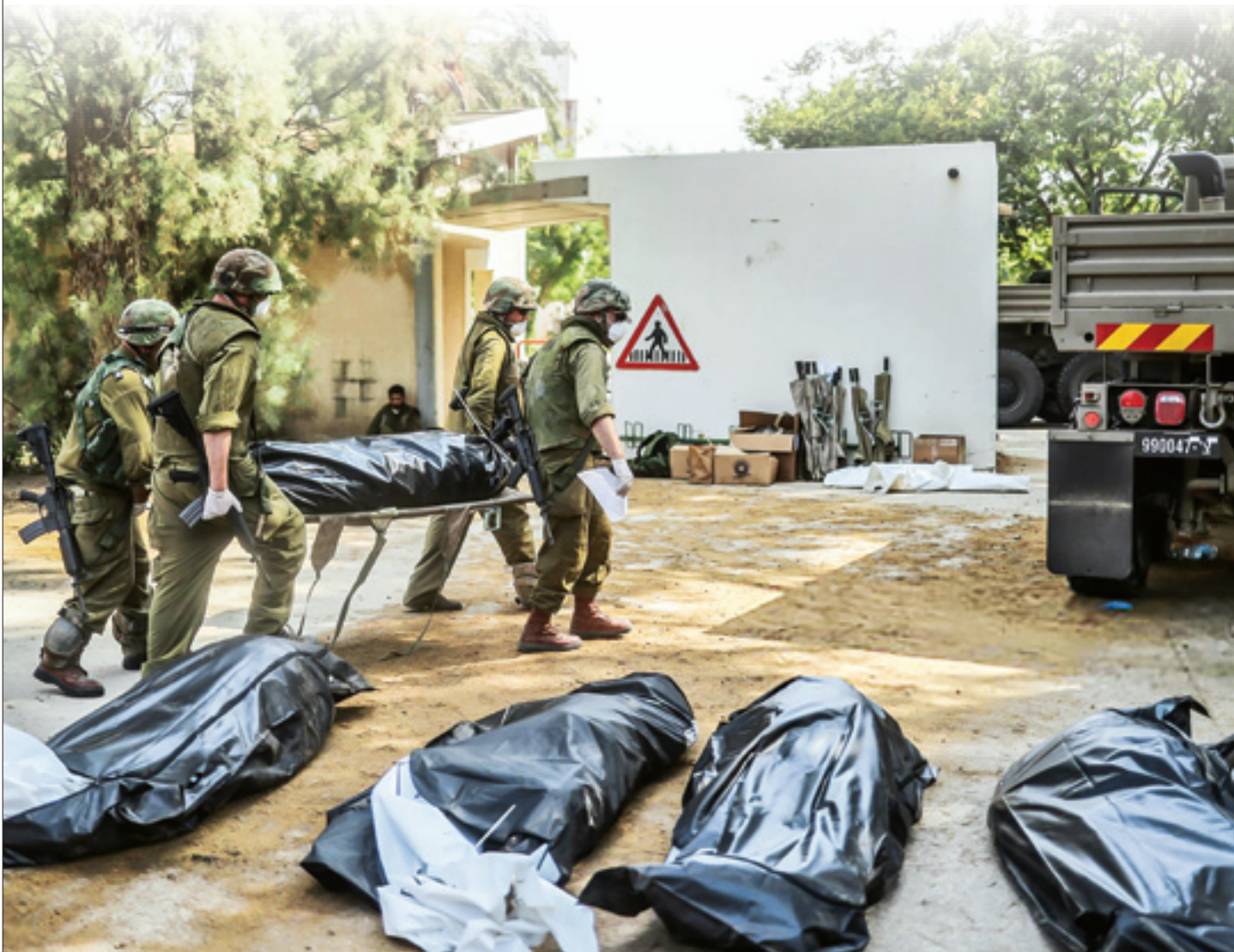
کشته‌های ارتش اسرائیل به رقم ۲۰۰ نزدیک شده اما مقاومت هشدار داد اگر ارتش صهیونیست‌ها وارد غزه شود نصف سربازان آن را به هلاکت خواهد رساند | صفحه ۱۵

غزه پنج روز بعد از طوفان الاقصی همچنان مثل شیر می‌غرد، چه در شلیک موشک‌ها به تل‌آویو و عسقلان و چه در تهدیدی که علیه صهیونیست‌ها کرد: «وارد غزه شوید، نصف ارتش تان را نابود می‌کنیم». این اقتدار از دل ویرانی‌های گسترده و سیستماتیک غزه که جنایت بزرگی علیه بشریت است به گوش می‌رسد و پس از آنکه نتایج او وعده داده بود اسرائیل وارد غزه می‌شود و خاورمیانه را عوض می‌کند، اوج جانی بودن صهیونیست‌ها در عین بیچارگی‌شان با آن ارتش کذا آنجاست که یک نماینده کنست به ارتش پیشنهاد داد از سلاح اتمی علیه غزه استفاده کند!