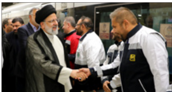
فرمانده کل قوا در دانشگاه افسری امام علی خطاب به سران صهیونیست فرمود: «مقصر خود شما هستید، خودتان بلایا بر سر خودتان آوردید» | صفحه ۲ | Leader.ir

چهار ایستگاه جدید در خطوط ۶ و ۷ مترو تهران در مراسمی با حضور آیت‌الله سید ابراهیم رئیسی، رئیس‌جمهور و مسئولان شهری پایتخت بطور همزمان افتتاح و عملیات حفاری خط ۱۰ مترو نیز به صورت رسمی آغاز شد. با افتتاح ایستگاه‌های شهر زیبا، شهران و شهید آرمان علی‌وردی (کوهسار) و ۶ کیلومتر مسیر جدید در خط ۶ مترو و ایستگاه مترو میدان کتاب و ۳ کیلومتر مسیر جدید