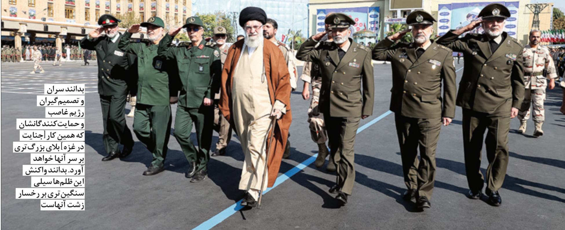
فرمانده کل قوا در دانشگاه افسری امام علی خطاب به سران صهیونیست فرمود: «مقصر خود شما هستید، خودتان بلایا بر سر خودتان آوردید» | صفحه ۲ | Leader.ir

بدانند سران و تصمیم‌گیران رژیم غاصب و حمایت‌کنندگانشان که همین کار اجنایت در غزه‌ا بلای بزرگ‌تری بر سر آنها خواهد آورد. بدانند واکنش این ظلم‌ها سیلی سنگین‌تری بر رخسار زشت آنهاست