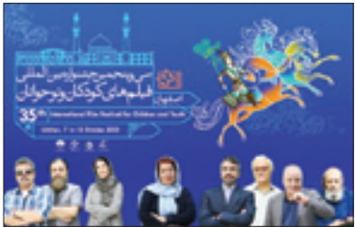
دوره ۱۵ جشنواره هستند. سی و پنجمین جشنواره بین‌المللی فیلم‌های کودکان و نوجوانان از ۱۵ تا ۲۰ مهرماه ۱۴۰۲ (هفتم تا دوازدهم اکتبر ۲۰۲۲) در اصفهان برگزار می‌شود.