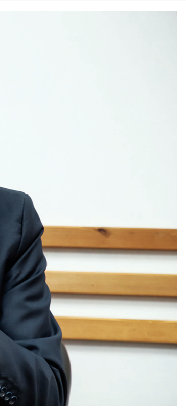
رئیس‌جمهوری ایران در دیدار با اعضای هیئت‌مدیره مرکز پژوهش‌های مجلس

هم این و هم با زحمت خود بچه‌های مرکز به این نتیجه رسیده‌ایم. ما یک برنامه‌ریزی داشتیم و برنامه سالانه با نظارت و پایش‌های فصلی انجام دادیم. به طور نمونه ۱۷۲۱ اقدام در ۱۴۰۱. این چشم‌انداز به طور فصلی پایش می‌شود و این مسئله باعث شده است دفاتر فعالیت‌هایشان را تقویت کنند. علاوه بر این پاسخ‌دهی به درخواست‌های کارشناسی نمایندگان از ۲۹ به ۷۵ رسید. ۲۵ درصدی هم که نمی‌توانستیم پاسخ دهیم به این دلیل بود که نیازمند