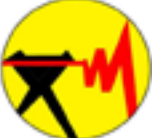
شرکت توزیع نیروی برق استان آذربایجان غربی

معکوس نبوده است و با تحلیل و دستیابی به تکنولوژی از صفر جریان سنج های چند فازی طراحی و ساخته شد، به طوری که حتی در دستاورد بومی سازی این MPFM ها، مواد و مشکلات بومی سازی پیشین نیز مورد بهینه سازی قرار گرفتند که خود مزیت دیگر این طرح بود.