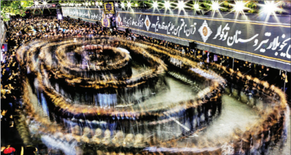
عزاداران ناشناسی گویان تیریز از طلی‌حفظ حکومت ایران