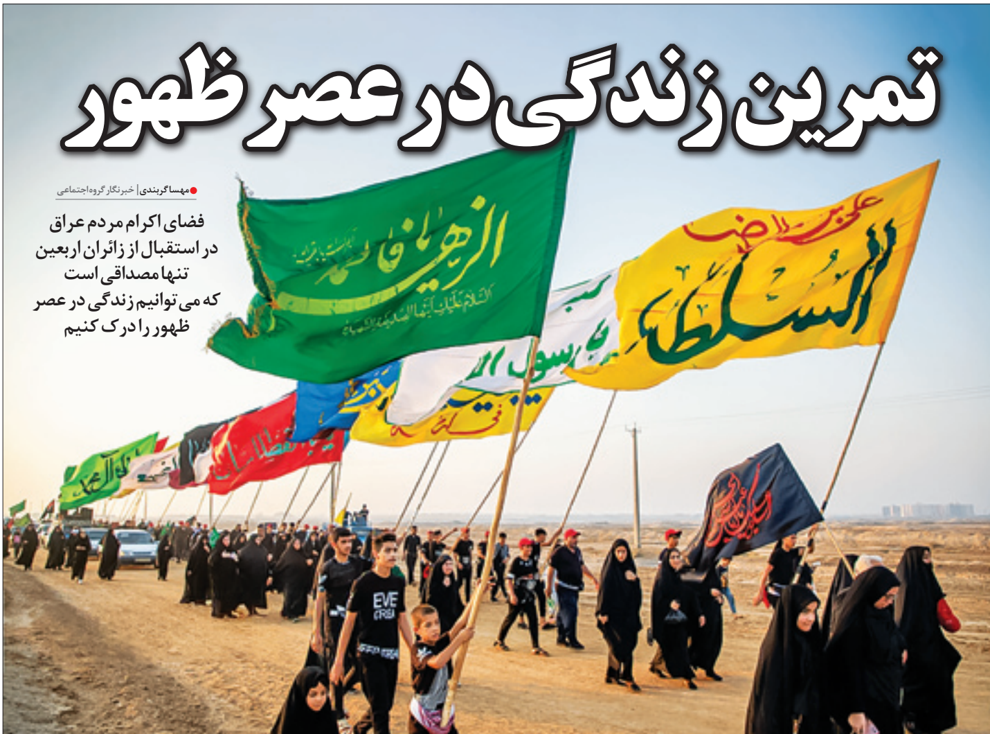
راهپیمایی اربعین به واقع از آن الطاف خفیه الهی بود که در این عصر رخ نمود. حرکت کاروان پیاده‌روی عشاق الحسین (ع) از سریندر استان خوزستان یکی از ده‌هزار جلوه‌ای مناسک بی‌بدیل است | صفحه ۶ | علیرضا محمدی ایستا

فضای اکرام مردم عراق در استقبال از زائران اربعین تنها مصداقی است که می‌توانیم زندگی در عصر ظهور را درک کنیم