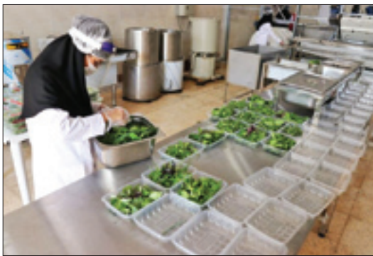
«اقتصاد مقاومتی» بهترین نسخه برای استفاده از ظرفیت‌های موجود در روستاهاست