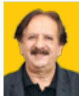
فیلمساز مجید مجیدی

تاسوعا و عاشورایی که بر ما و ایران گذشت، نشان داد مهر و عشق حسینی نه با های وهوی مدعیان آزادی عقیده که خود مستبدانی بی نظیرند خاموش می‌شود، نه با شبهه افکنی های روشنفکرانی که دل های شان را تاریکی دوری از خدا فرا گرفته کمرنگ می‌شود، نه پهره برداری های ناچوآنر دانه سیاسی، مردم را از آن فراری می‌دهد و نه فتاوی ا نان به‌ترخ روزخوران وهابی مسلک در سلوک این ملت تأثیر می‌گذارد.