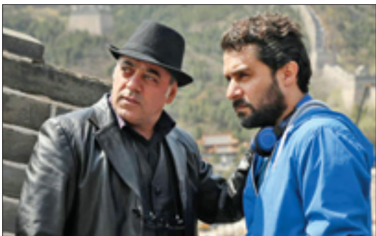
به سفارش مرکز فیلم و سریال معاونت برون مرزی صداوسیما