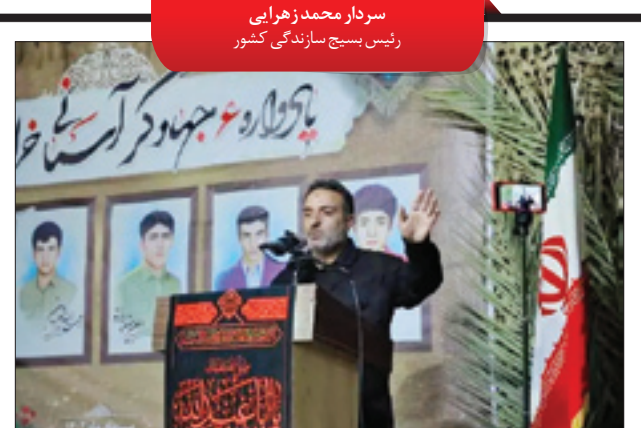
سردار محمد زهرابی رئیس بسیج سازندگی کشور

در سال جاری برنامه‌ای تحت عنوان یادواره شهیدهای جهادی استانی و یادواره ملی جهادگران آسمانی را در دستور کار داریم. یادواره ملی شهیدهای جهادگران آسمانی در شیراز برگزار شد و این یادواره مقدمه‌ای می‌شود برای کنگره ملی شهیدهای جهاد و خدمت که در سال ۱۴۰۳ به صورت ملی برگزار خواهد شد. طی این مدت محتوا، مطالب مکتوب و مستندات آماده می‌شود تا به سطح مورد نظر برسد. کنگره ملی شهیدهای جهاد و خدمت را با همکاری وزارت جهاد کشاورزی و سایر نهاد‌های ذی‌ربط برگزار خواهیم کرد. یکی از رسالت‌های مهم بسیج، مأموریت‌های رفیع محرومیت‌ها در بخش بسیج سازندگی است. سال گذشته ۱۹ هزار و ۵۰۰ پروژه محرومیت‌زدایی در سراسر کشور به پایان رسید. بر همین اساس کار مشترکی بین دستگاه‌های اجرایی با حمایت مجلس شورای اسلامی، دولت، نهاد‌های مردم‌پایه و