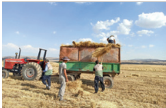
جهادگران در نقاط مختلف کشور به یاری کشاورزان رفتند