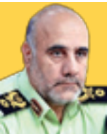
سردار حسین رحیمی رئیس پلیس امنیت اقتصادیفرجا

اقتصاد از جمله مهم‌ترین و بنیادی‌ترین مسائل هر جامعه و مجموعه‌ای محسوب می‌شود که می‌تواند در رشد و توسعه مادی و حتی معنوی آنها نقش تأثیر گذاری داشته باشد. در کشور ما هم با توجه به تلاش‌های مجدانه و مصرا نه دشمنان برای به چالش کشیدن حاکمیت با استفاده از تحریم‌ها و فشارهای ظالمانه و همه‌جانبه اقتصادی این مهم از اهمیت صد چندانی برخوردار است، بنابراین رشد و شکوفایی اقتصاد کشور با عنایت به جبهه‌گیری‌های آشکار دشمنان و پارگیری‌های آنان در این خصوص