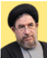
محمدرضامیرتاج‌الدینی عضو کمیسیون برنامه، بودجه و محاسبات مجلس

اگر در کشور ما فرار مالیاتی و اجتناب افراد از پرداخت مالیات وجود دارد، به دلیل نبود داده‌های مناسب است و با استقرار نظام مالیاتی هوشمند و حرکت به سمت هوشمندسازی فرآیند اخذ مالیات در کنار تکمیل داده‌های اقتصادی موردنیاز جهت اخذ هوشمند مالیات، به سمت اصلاح نظام مالیاتی خواهیم رفت. امسال مجموعه دولت و به خصوص سازمان امور مالیاتی با جدیت بیشتری در مسیر اصلاح آن حرکت کردند