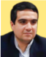
سلمان اسحاقی عضو کمیسیون بهداشت و درمان مجلس