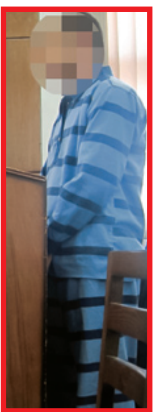
گمشده هم پیدا کردند.

پس از اعتراف متهم، مأموران به نشانی که در حالی که یک ماه از حادثه گذشته بود و مأموران همچنان در تلاش بودند تا پسر گمشده را پیدا کنند، مرد مغازه‌داری با اداره پلیس تماس گرفت و راز قتل پسر نوجوان را بر ملا کرد.