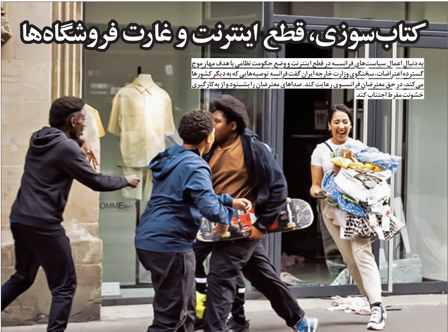
به دنبال اعمال سیاست‌های فرانسه در قطع اینترنت و وضع حکومت نظامی با هدف مهار موج گسترده اعتراضات، سخنگوی وزارت خارجه ایران گفت فرانسه توصیه‌هایی که به دیگر کشورها می‌کند، در حق معترضان فرانسوی رعایت کند. صداهای معترضان را بشنوند و از به‌کارگیری خشونت مفرط اجتناب کند

بیش از هزار سرباز رژیم صهیونیستی زیر پوشش هوایی آپاچی‌ها و پهپادها، از یک‌شنبه شب به جنین حمله کرده‌اند؛ شهری ۴۰ هزار نفری که به نماد تسلیح مقاومت در شمال کرانه باختری تبدیل شده است. حملات اسرائیل به این شهر منجر به شهادت دست‌کم ۱۰ فلسطینی و زخمی شدن دهها تن دیگر شده است. در حالی که خیابان‌های جنین به صحنه نبرد تن‌به‌تن بین نظامیان رژیم صهیونیستی و فلسطینیان تبدیل شده، اتاق عملیات مشترک نیروهای مقاومت فلسطین در غزه هشدار داد نیروهای مقاومت در تمامی میدان‌های نبرد اجازه نخواهند داد که دشمن