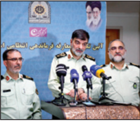
طرح‌های محله‌محور بر اساسی دغدغه‌های مردم عملیاتی می‌شود

فرمانده فراجا با بیان اینکه طرح امنیت محله‌محور با هدف رفع دغدغه مردم هر محله اجرا می‌شود، گفت: همکاران من موظف هستند دغدغه‌های انتظامی مردم هر محله را شناسایی کنند و روی آن دغدغه عملیات انجام دهند.