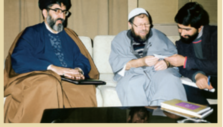
دهه ۶۰ آیت‌الله‌سیدهادی خسروشاهی در کنار عباس عدلی، رهبر جبهه‌نجات الجزایر

■ فعالیت‌های تقریبی آیت‌الله محمدعلی تسخیری در دوران پیش از پیروزی انقلاب اسلامی