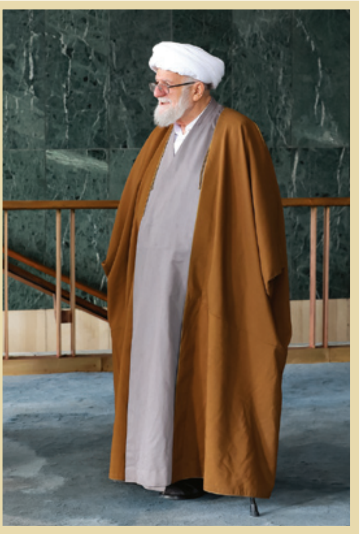
دهه ۹۰ آیت‌الله محمدعلی تسخیری

استاد سیدهادی خسروشاهی براساس دغدغه‌های تقریبی خویش و در فرایند ارتباط‌گیری با بزرگان اخوان المسلمین مصر، مبارزان مسلمان الجزایر، مبارزان مسلمان تونس و سودان و همچنین بزرگان نهضت اسلامی افغانستان، آن هم در دوره پیش از پیروزی انقلاب اسلامی، توانسته بود آنها را با اهداف نهضت اسلامی مردم ایران به رهبری امام خمینی آشنا کند