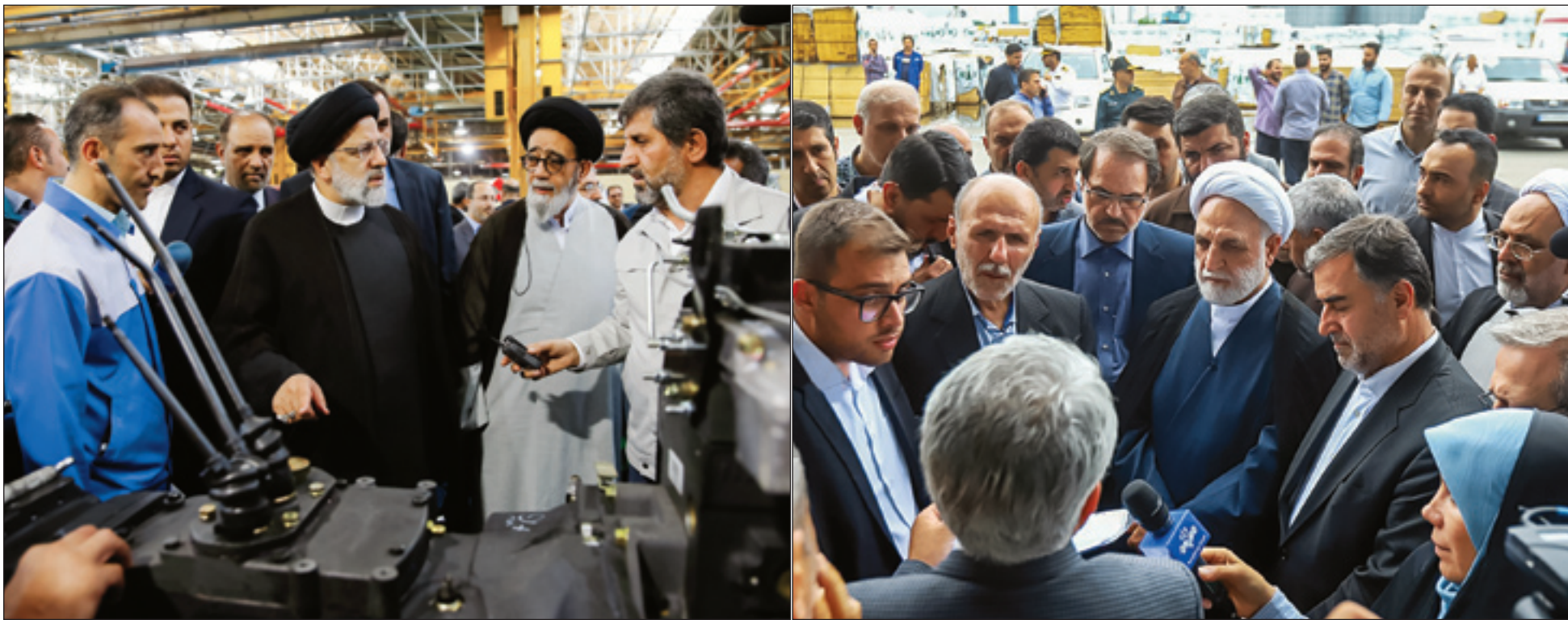
روز جمعه در وقت استراحت عام فرصتی است برای دو رئیس قوه که اجرا و نظارت را با کار جهادی و بی‌وقفه به ثمر برسانند و خواب و استراحت مدیران خسته و ناکارآمد را آشفتنه سازند.

رئیس‌جمهور و رئیس‌قوه قضائیه در آذربایجان و مازندران کاری جهادی کردند. افتتاحیه‌های بزرگ همراه با مجازات و نظارت بر مدیران خسته و ناکارآمد