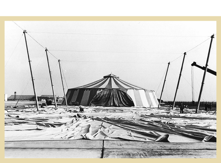
فضای از چادرهای برپا شده در جشن‌های ۲ هزار و ۵۰۰ساله شاهنشاهی

یکی از این گروه‌ها، روحانیون و در رأس آنها امام خمینی (ره) و جریبان مذهبی مبارز بودند. روحانیون در سخنرانی‌های خود، از سبک برگزاری جشن‌ها و مواضع دین‌ستیزانه عوامل این برنامه انتقاد می‌کردند. همچنین تحقیر دستاوردهای تمدن طلایی اسلام