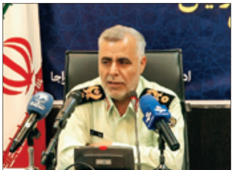
رئیس پلیس آگاهی فراجا در پاسخ به پرسش «جوان» درباره چرایی افزایش جرائم مسلحانه: