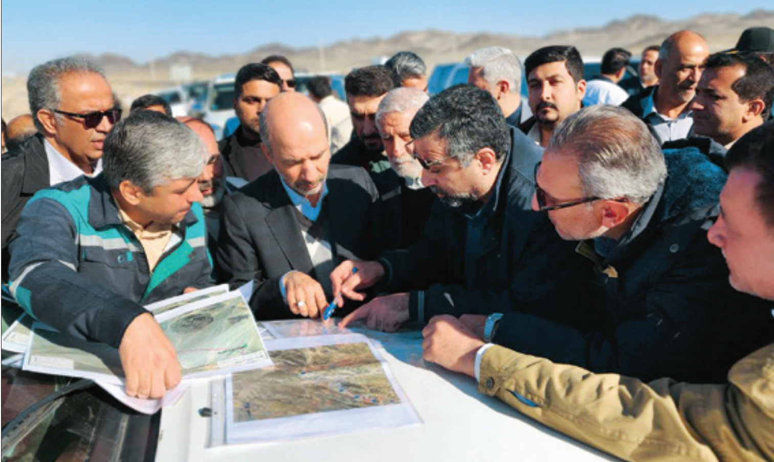
وزیر نیرو در بازدید از مراحل اجرایی بزرگ‌ترین آب‌شیرین‌کن خشکی جهان، روند آن را پرشتاب و رضایت‌بخش توصیف کرد

در سالروز ولادت حضرت عباس علیه‌السلام و روز جانباز انجام شد