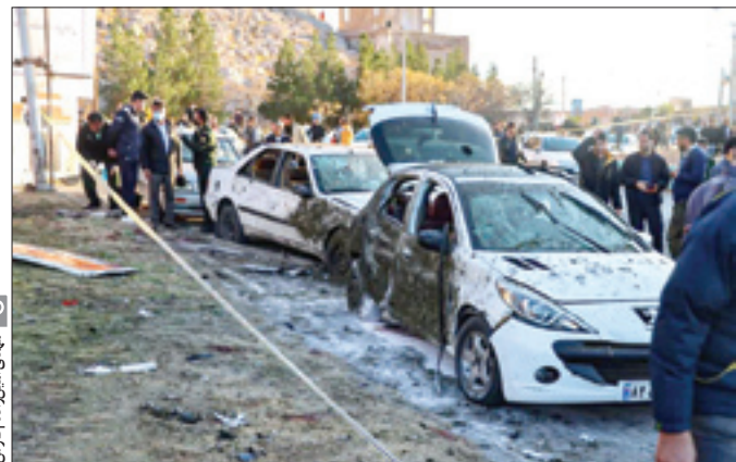
نگاهی به «تروریسم» در آیین ۲ فیلم سینمایی «هناس» و «ضد»