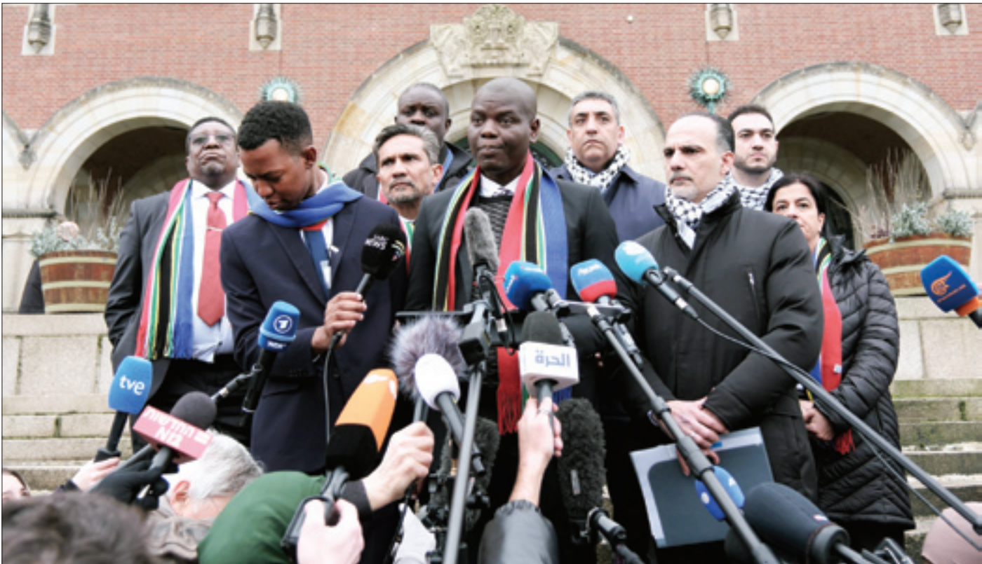
تحلیل‌های متفاوتی درباره جرایم دادگاه لاهه علیه صهیونیست‌ها ارائه می‌شود. صرف‌نظر از همه آنها، این حال و روز رژیم صهیونیستی چیزی نیست که بتوان به سادگی از کنار آن گذشت

صهیونیست‌ها که با اقدام حقوقی آفرنقای جنوبی در دادگاه لاهه عملاً با اتهام نسل‌کشی مواجه شده‌اند و ادله و شواهد متعدد و کلادار کشتار هدفمند و آزار فلسطینیان راهکاری غیر از مغلظه و انکار برای آنها نگذاشته، به رغم حمایت همه‌جانبه آمریکا در موقعیتی قرار گرفته‌اند که بنابر اعتراف یکی از روزنامه‌نگاران صهیونیست نه تنها شکست خوردند بلکه بدترین روز از آغاز جنگ اخیر غزه را تجربه کردند | صفحه ۱۵