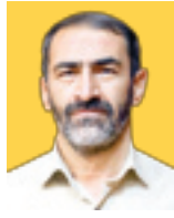
حسین عبدالله‌پدر کارشناس سیاسی

و سرزمین ایران را با حذف پهلوی، برای همیشه تاریخ برای منافع آمریکا بی ثبات کرد.