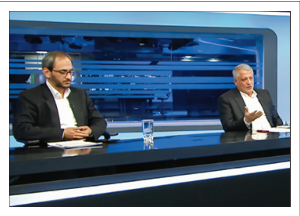
یازدیک شدن به موعد برگزاری انتخابات مجلس

شورای اسلامی و خبرگان رهبری در ۱۱ اسفندماه امسال، نتور مناظره‌های انتخاباتی هم رفته رفته و به گرم شدن است. اگر چه این تاکو به صورت طبیعی در افسار مختلف مردم کمتر دیده می‌شود، اما حضور احزاب و گروه‌های سیاسی در تریبون‌های مختلف نوید یک رقابت قوی و سپس یک مشارکت قابل قبول را نوید می‌دهد. خصوصاً آنکه بنا به اظهارات مسئولان اجرایی نمایندگان همه احزاب و گروه‌های سیاسی در این رقابت‌ها حضور دارند. نشانه‌های این مهم را می‌توان در مواضع و سخنرانی‌های فعالان سیاسی جریان‌های شناخته شده جست‌وجو کرد. یک‌شنبه شب گفت‌وگوی ویژه خبری در رسانه ملی اگر چه یک سوسی مناظره یک فعال سیاسی اصلاح‌طلب بود، اما سوسی دیگر این مناظره عضو پژوهشکده شورای نگهبان بود که آمده بود ضمن تبیین جایگاه قانونی این شورا در قانون اساسی و اختیاراتی که قانون اساسی به آن داده است، به برخی شبهات در باره عملکرد شورای نگهبان پاسخ بدهد. علی بهادری جهرمی حقوقدان و محسن هاشمی فعال سیاسی اصلاح‌طلب در این مناظره تلویزیونی به موضوع انتخابات و نقش شورای نگهبان در آن پرداختند و ایعاد مختلف احصرا از یاد صلاحیت نامزد‌ها را مورد بحث و بررسی قرار دادند.