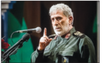
فرمانده نیروی قدس:

روزنامه سیاسی، اجتماعی و فرهنگی صبح ایران چهارشنبه ۳۰ آذر ۱۴۰۱ - ۲۶ جمادی الاول ۱۴۴۴ سال بیست و چهارم - شماره ۶۶۵۵ - ۱۶ صفحه قیمت: ۳۰۰۰ تومان