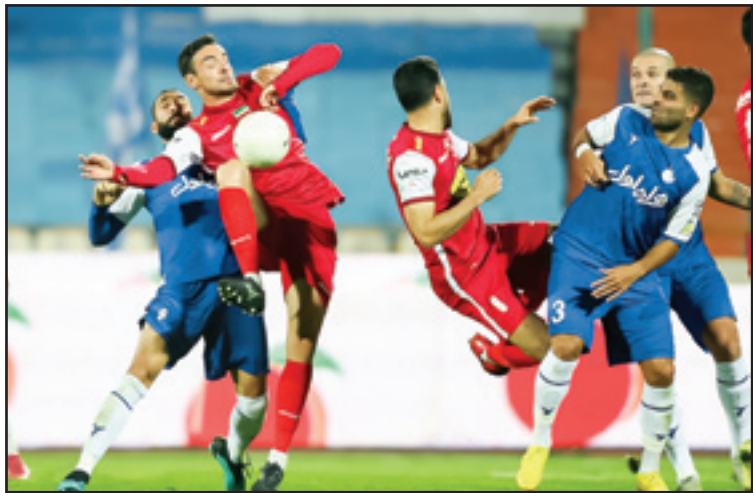
گولسیانیی بزرگ برنده پرسپولیس

دکتر احمد ساویز، روانشناس و عضو هیئت علمی دانشگاه: در سبک زندگی و شهرنشینی نسبتاً شفته و پرهیاهوی امروز، جوان ما فرصت‌های اندکی برای انس با مبنای فرهنگ ملی خود دارد و از سوی دیگر دائماً از طریق ابزار گسترده اطلاعاتی و رسانه‌ها با فرهنگ دیگری که مبنای تجاری و مادی دارد و با فرهنگ ملی او ناسازگار است، بمباران می‌شود. این گستردگی منابع اطلاعاتی، فرصت عمیق شدن و فکر کردن را از او می‌گیرد، به گونه‌ای که در اقیانوس اطلاعاتی که به او