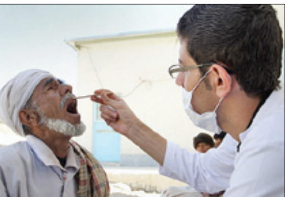
برگزاری اردوی پزشکان و دندانپزشکان جهادگر در مناطق کم‌برخوردار با خدمات رایگان