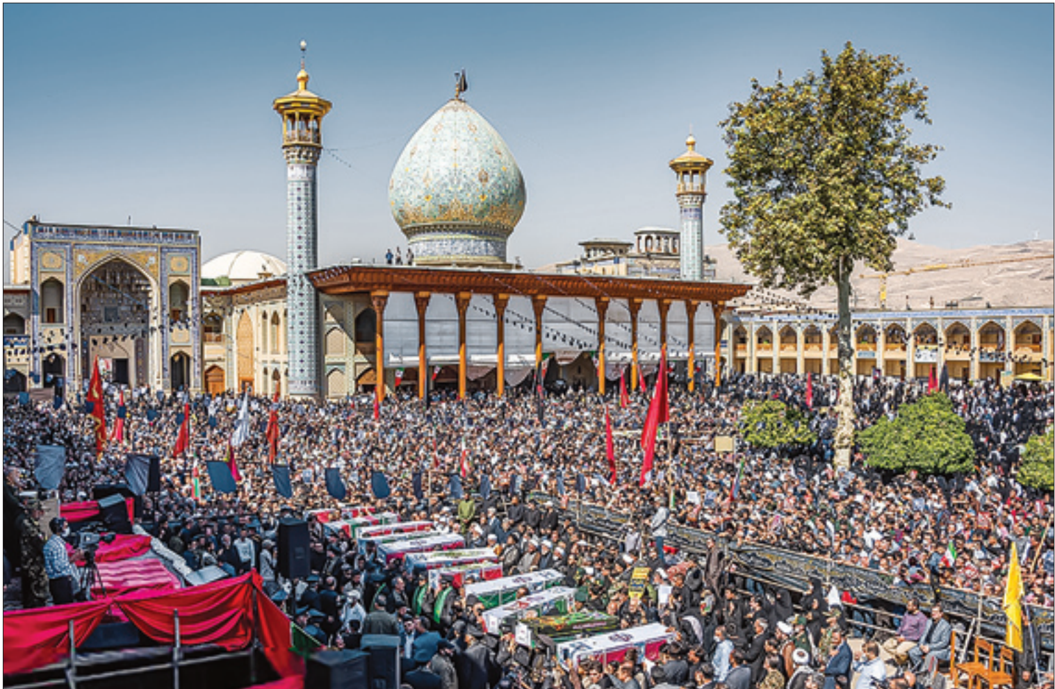
ظهور و پیش آمدن

می‌زند نیز هشدار داد که دیگر این رفتارها تحمل نمی‌شود. تا امروز در تهران بزرگ حتی یک آشوبگر کشته نشده اما شش نفر از مدافعان امنیت یا بسیجیانی که حتی در میان مدافعان امنیت نبودند و در جریان زندگی عادی خود بودند، با تیغ ترور و خشونت آشوبگران به شهادت رسیده‌اند و این نشانه مدارا با آشوبگران تا امروز بوده است. پاسداران امنیت در روزهای آینده تروریسم تکفیری و رسانه‌ای و آشوبگر را یکجا به جرم برهم‌زدن آرامش مردم و قتل فرزندان آنان مجازات سخت خواهند کرد | صفحه ۲