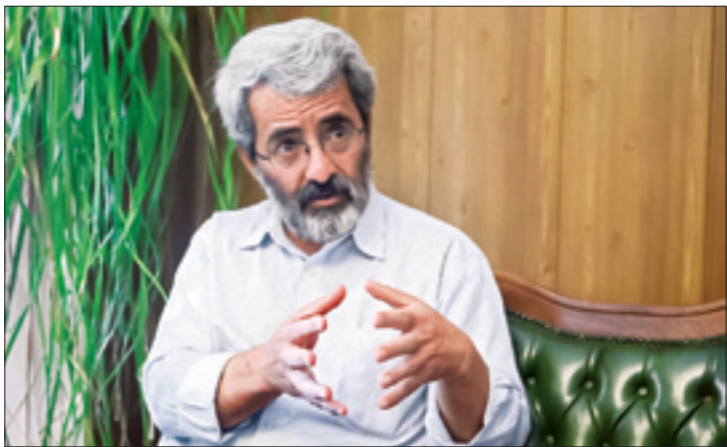
سرمربی تیم ملی حتی با معذوری از دعوت‌شدگان به اردو، با انگیزه‌نشان می‌دهد. این تیم فقط روحیه می‌خواهد

انگلیسی آماده‌باش! ما داریم می‌آیسم. برقدردت و متمرکز. همان‌طور که سرمربی تیم ملی ما می‌گوید ما وقت خود را برای حاشیه‌هایی که ارزش بحث کردن ندارند، نمی‌گذاریم. (اشاره کی‌روش به کمیسیون وطن‌فروشان برای حذف ایران از جام جهانی است) ما فقط به آماده‌شدن و امتیاز گرفتن از انگلیس فکر می‌کنیم. پس انگلیس خوشحال نباش که رقیب ایرانی! فقط آماده‌باش، چون ما با تو انگیزه‌ها و داستان‌ها داریم! برای یک بازی بزرگ آماده‌باش که در آن بچه‌های ایران مارادونا‌های ۱۹۸۶ هستند. دست‌خدا نیز همراه آنهاست! خوب دقت کن که ما به خوبی تو را زیر نظر گرفته‌ایم. امروز فیفا به ما پیشاپیش برای ورود به جام جهانی تبریک گفت و سرمربی ما حاضر نشد برای همه دشمنی‌های وطن‌فروشان و رسانه‌های فارسی‌زبان که دنبال حذف ایران از جام جهانی‌اند، بیش از دو کلمه «حاشیه» و «ارزشی ندارد»، وقت و حرف و کلمه صرف کند. پس انگلیس هم تو آماده‌باش و هم آنها می‌کنند که در لندن مرگ فوتبال ایران را می‌کنند. بقیه در صفحه ۱۳