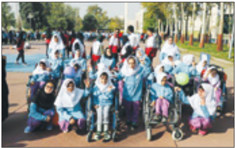
مراسم ۲۴ مهر ماه با میهمان ویژه در آزادی برگزار شد