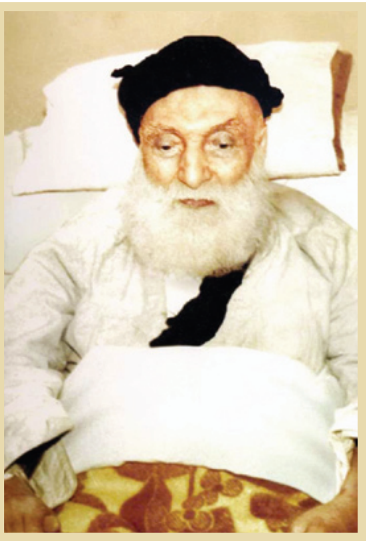
فروردین ۱۳۴۰. آیت‌الله‌عظمی بروجردی در بستر بیماری