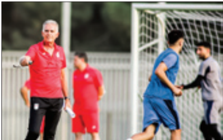
مینی کمپ تیم ملی