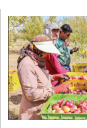
معاون وزیر جهاد کشاورزی در امور باغبانی با باغداران در استان خراسان جنوبی

وی افزود: با وجود این خسارات تولید میوه در یک سال گذشته دولت سیزدهم افزایش یافته است و از ۲۴ میلیون تن به ۲۵ میلیون و ۷۰۰ هزار تن رسید است و پیش‌بینی می‌شود در بخش مرکبات بیش از ۳۰۰ هزار تن افزایش داشته باشیم که در بخش تولیدات گیاهان دارویی نیز ۶۰ هزار تن افزایش می‌یابد.