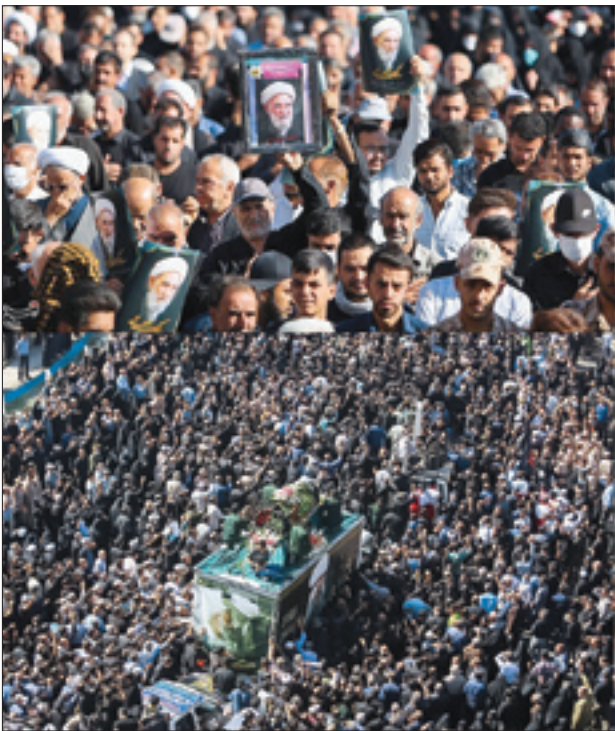
مرتضی مطهری، استپم