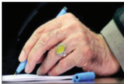
پیام رهبر انقلاب به جشنواره ملی سرود فجر